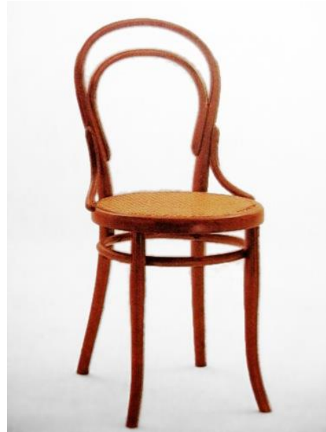
Chaise Thonet n°14, image Wikipédia